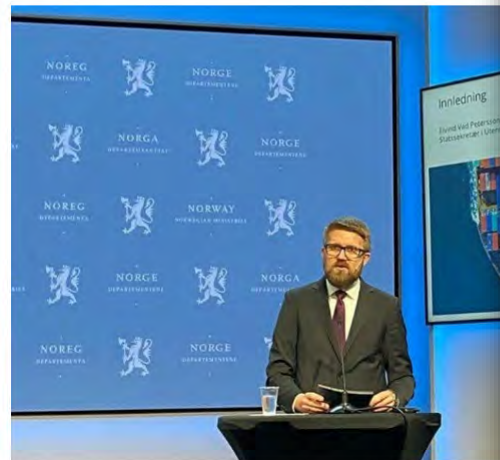
Statssekretær i Utenriksdepartementet Eivind Vad Petersson (Ap) mener sikkerhetspolitikk kan komme til å delta i eksport av kunnskap til utenlandske forskere.

Akademisk frihet og norsk sikkerhetspolitikk på kollisjonskurs i forslag til forskrift om eksport av kunnskap. – Flere dilemmaer